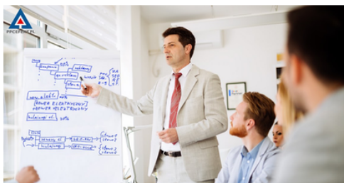
Nagranie FHD z sali